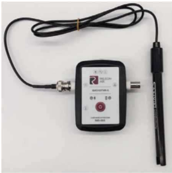
Рис. 5. Датчик электропроводимости

Датчик температуры окружающей среды — измеряет температуру воздушной среды. Датчик встроен в мультидатчики по биологии и экологии.