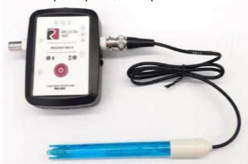
Рис. 9. Датчик водородного показателя (рН)

д) в боксе всегда должен быть трёхмолярный раствор хлорида натрия, следует заранее позаботиться о запасе раствора, т. к. он немного проливается при извлечении электрода, в сухом боксе электрод скоро выйдет из строя.