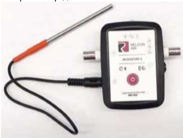
Рис. 6. Датчик температуры растворов

Датчик температуры растворов — измеряет температуру растворов и сыпучих тел. Оснащён выносным и герметичным температурным зондом, устойчивым к лабораторным реагентам (рис. 6). Диапазон измерений от -40 до +180 °С. Технологические особенности: для получения достоверных данных весь зонд должен находиться в измеряемой среде, в противном случае возникает значительная погрешность из-за теплопередачи по металлическому зонду и рассеяния либо поглощения энергии в том месте, где он не находится в измеряемой среде.