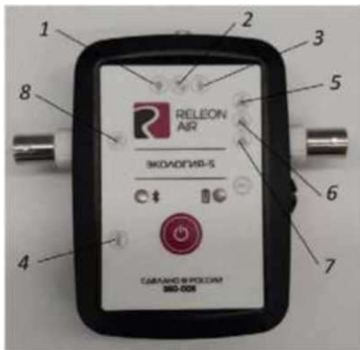
Рис. 3. Мультидатчик по экологии: 1 — освещённость, 2 — относительная влажность воздуха, 3 — температура окружающей среды, 4 — температура растворов, 5 — нит-рат- ионы, 6 — хлорид-ионы, 7 — pH, 8 — электропроводность

Мультидатчик по физиологии позволяет определять артериальное давление, пульс, температуру тела, частоту дыхания, ускорение движения (рис. 3).