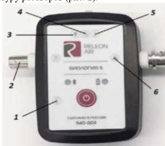
Рис. 2. Мультидатчик по биологии: 1 — температура растворов, 2 — электропроводимость, 3 — освещённость, 4 — относительная влажность воздуха, 5 — температура окружающей среды, 6 — рН

Мультидатчик по биологии позволяет измерять следующие показатели: влажность воздуха электропроводимость освещённости рН температуру окружающей среды (воздуха), температуру растворов (рис. 2).