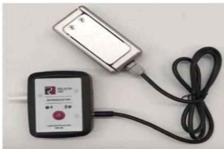
Рис. 17. Датчик кистевой силы (эргометр)

Датчик кистевой силы (эргометр, силомер) — измеряет сжимающее усилие, создаваемое кистью руки (рис. 17). Диапазон измерений: от -50 до +50Н. Разрешение: 0,02Н.