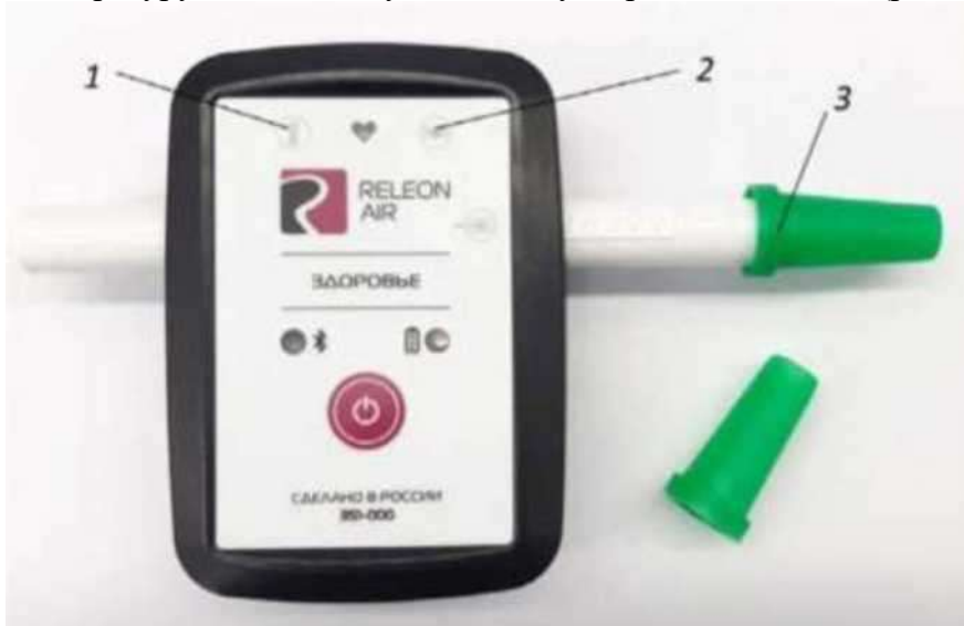
Рис. 3. Мультидатчик по физиологии: 1 — температура тела, 2 — пульс, 3 — частота дыхания (надет съёмный мундштук)

Мультидатчик по физиологии позволяет определять артериальное давление, пульс, температуру тела, частоту дыхания, ускорение движения (рис. 3).