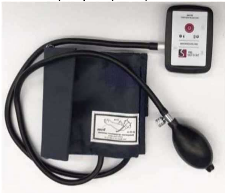
Рис. 13. Датчик артериального давления

Датчик артериального давления — позволяет измерять артериальное давление в диапазоне от 0 до 250 мм рт. ст. Разрешение датчика: 0,1 мм рт. ст. Датчик позволяет определить систолическое, диастолическое давление, пульс. В комплект датчика входит специальная манжета с утягивающим механизмом, нагнетатель воздуха с воздушным клапаном и трубка для подключения к датчику (рис. 13). Технологические особенности: необходимо контролировать плотность подключения разъёмов, правильность положения манжеты на плече. Воздух из манжеты следует спускать равномерно, медленно, слегка приоткрыв клапан нагнетателя.