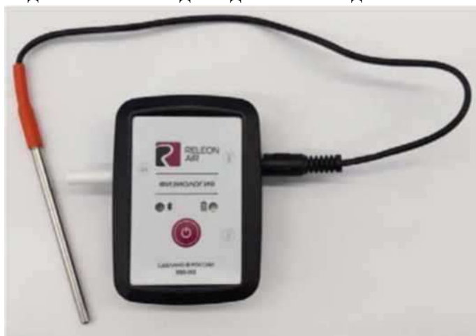
Рис. 12. Датчик температуры тела

Датчик температуры тела — предназначен для непрерывного измерения температуры тела в подмышечной впадине. Оснащён выносным зондом (рис. 12). Диапазон измерения: от 25 до 50 °С. Разрешение датчика: 0,1 °С. Технологическая особенность: для точного измерения в подмышечной впадине должна находиться вся металлическая часть зонда.