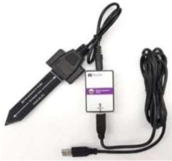
Рис. 4. Датчик влажности почвы

Датчик электропроводимости — предназначен для регистрации и измерения удельной электропроводности жидких сред, в том числе и водных растворов веществ (рис. 5). Применяется при изучении характеристик водных растворов, в том числе почвенных вытяжек