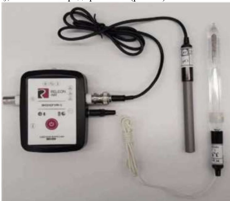
Рис. 10. Ионоселективный датчик (присоединены электрод хлорид-ионов и электрод сравнения)

При использовании датчиков нитрат-ионов и хлорид-ионов к специальному разъему мультидатчика по экологии необходимо подключать ионоселективный электрод (рабочий электрод), а также электрод сравнения (рис. 10).