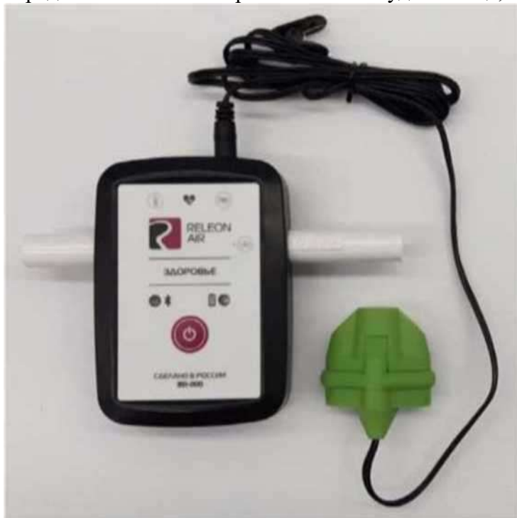
Рис. 14. Датчик пульса

Датчик пульса — позволяет непрерывно определять частоту сердечных сокращений. Имеет выносную клипсу, надеваемую на палец исследуемого (рис. 14). Диапазон измерения пульса: от 0 до 250 уд/мин. Разрешение: 1 уд/мин. Технологические особенности: следует контролировать правильность надевания клипсы, т. к. при излишне глубоком надевании она передавливает мелкие кровеносные сосуды пальца, что уменьшает точность измерений.