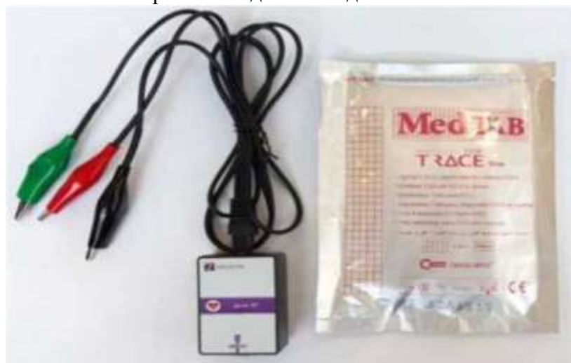
Рис. 16. Датчик электрокардиограммы (датчик ЭКГ)

Датчик ЭКГ — предназначен для измерения электрической активности сердца. Определяет параметры, необходимые для построения электрокардиограммы с помощью специальных одноразовых нательных медицинских электродов, поставляемых в комплекте с датчиком (рис. 16). Технологические особенности: график электрокардиограммы в программном обеспечении строится в одном отведении.