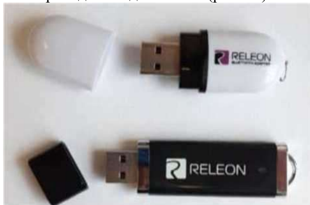
Рис. 18. Общий вид USB-флеш-накопителя (внизу) и Bluetooth-адаптера (вверху) Releon

В комплекте цифровой лаборатории Releon поставляется программное обеспечение Releon Lite на USB-флеш-накопителе, а также Bluetooth-адаптер для связи регистратора данных с беспроводными датчиками (рис. 18).