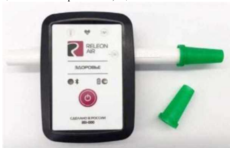
Рис 15. Датчик частоты дыхания

насадок, плотно надеваемых на дыхательную трубку (рис. 15). Диапазон измерения: от 0 до 100 циклов/мин. Разрешение: 0,5 цикла/мин.