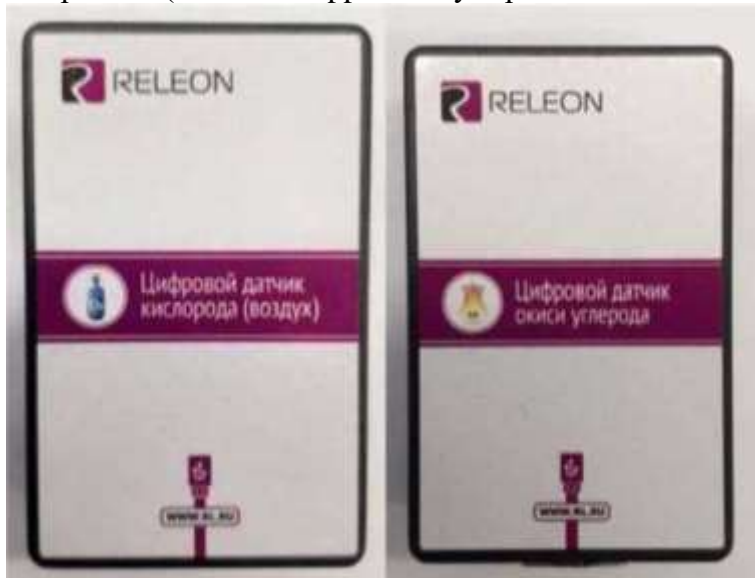
Рис. 11. Датчики кислорода (слева) и угарного газа (справа)

Датчик окиси углерода — измеряет концентрацию монооксида углерода (угарного газа) в окружающей среде (рис. 11). Диапазон измерения: от 0 до 1000 ppm (миллионные доли). Разрешение датчика: 1 ppm. Технологические особенности: при учёте в исследовании ещё и содержания кислорода потребуются пересчёт из миллионных долей в проценты для приведения к одной размерности (значение в ppm следует разделить на 10 000).