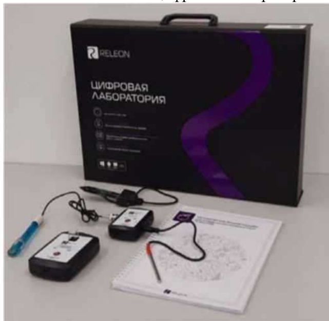
Рис. 1. Комплект цифровой лаборатории

В комплекте цифровых лабораторий содержатся мультидатчики и монодатчики.